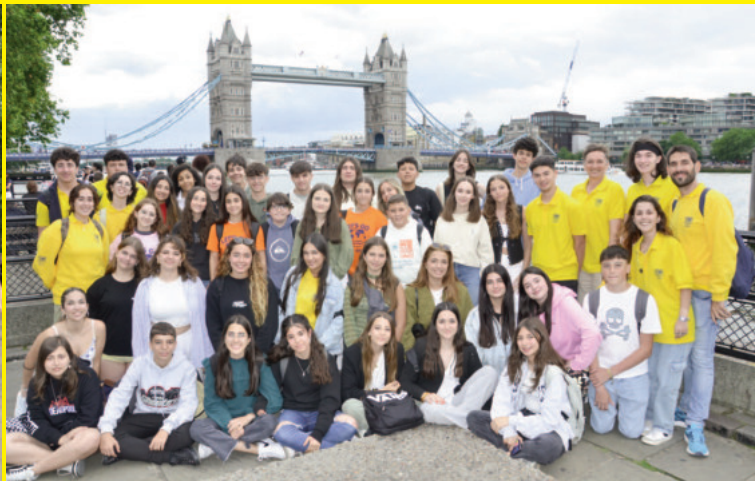
Durante la estancia lingüística realizarás dos excursiones de un día de duración a Londres.