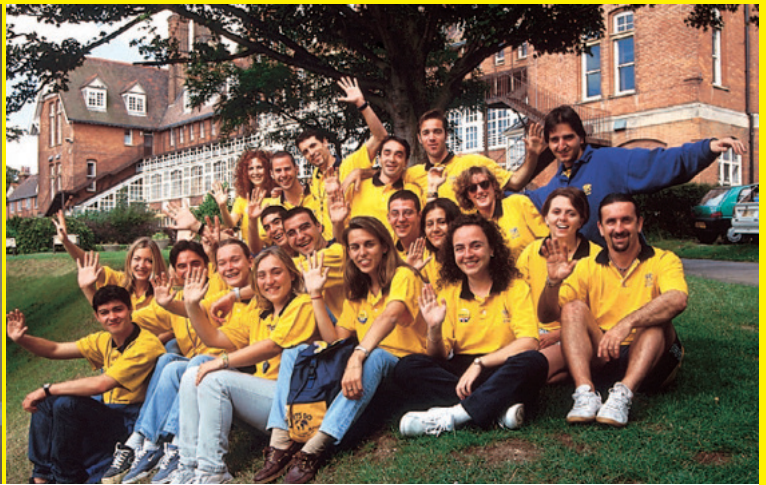
Te damos la bienvenida a las estancias lingüísticas de verano en Inglaterra LET'S GO.