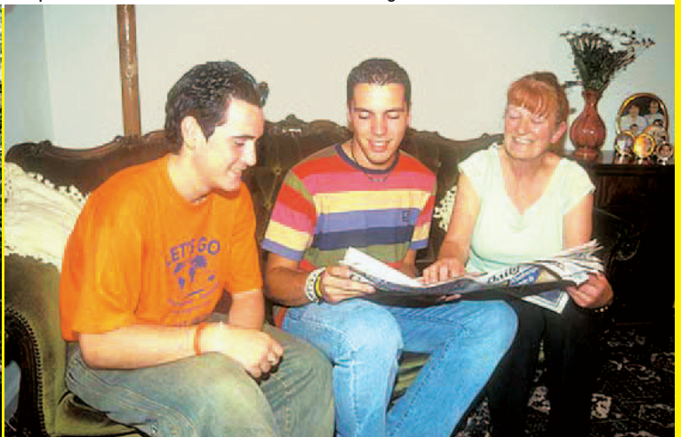
Tu familia británica anfitriona te ayudará para que tu estancia con ellos sea lo más agradable posible.