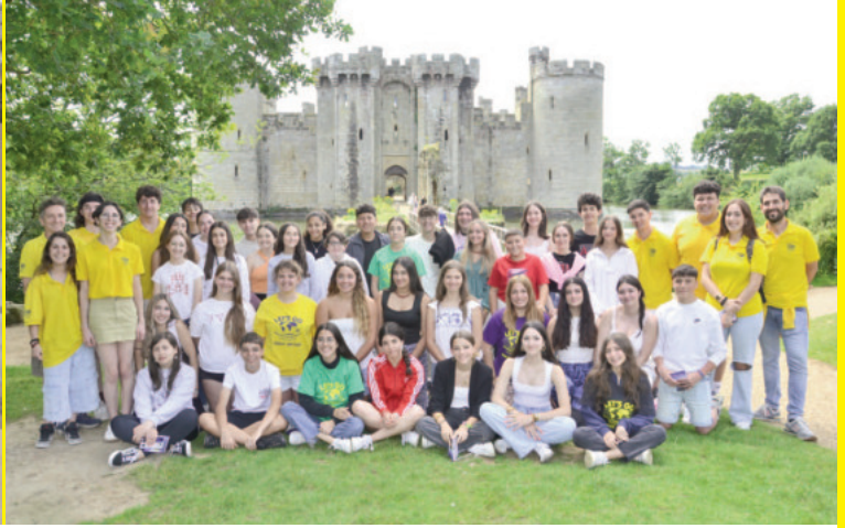
Semanalmente realizarás una visita a pie o en autobús a lugares de interés de la localidad de la estancia lingüística.