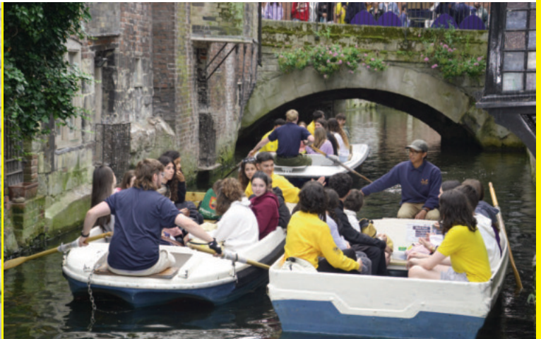
También podrás visitar otros lugares como un mercadillo, un museo o ir al cine.