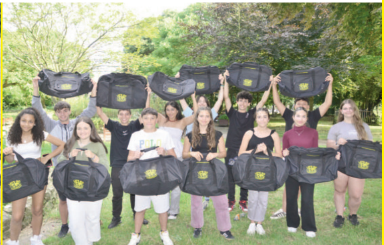
Los monitores organizarán una divertida competición de miniolympic games con premios para los equipos ganadores.