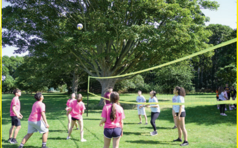
A lo largo de la estancia lingüística los monitores de LET'S GO te indicarán los deportes disponibles.