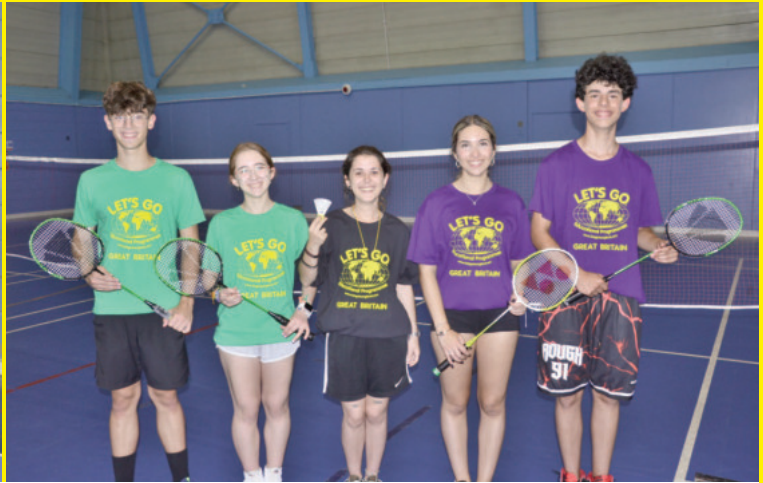
Dos días por semana asistirás a las instalaciones deportivas de la localidad británica para practicar diversos tipos de deportes.