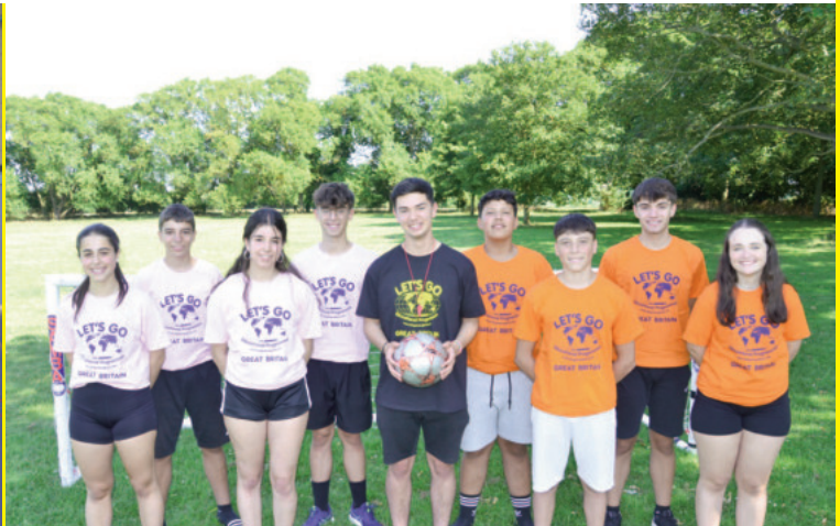
Tendrás la oportunidad de practicar deportes como bádminton, fútbol, ping-pong, piscina, voleibol, etc.