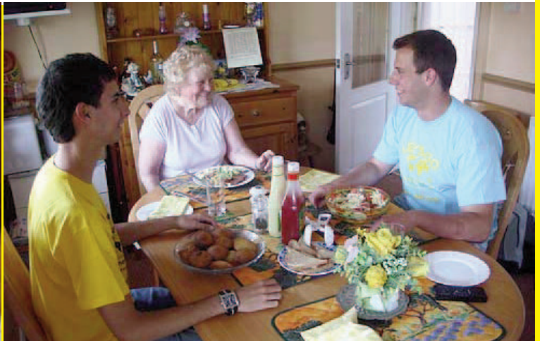
Estarás alojado en una familia anfitriona y conocerás personalmente la forma de vivir en Inglaterra.