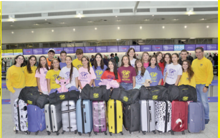
Realizarás los viajes de ida y vuelta en avión acompañado por un delegado de viaje de LET'S GO.