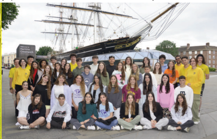
Tu participación en las estancias lingüísticas LET'S GO te proporcionará la vivencia de un verano muy útil e inolvidable.