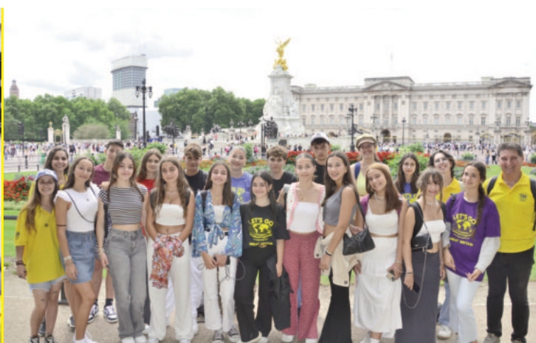
Estarás ocupado prácticamente durante todo el tiempo y aprovecharás al máximo tu estancia en el extranjero.