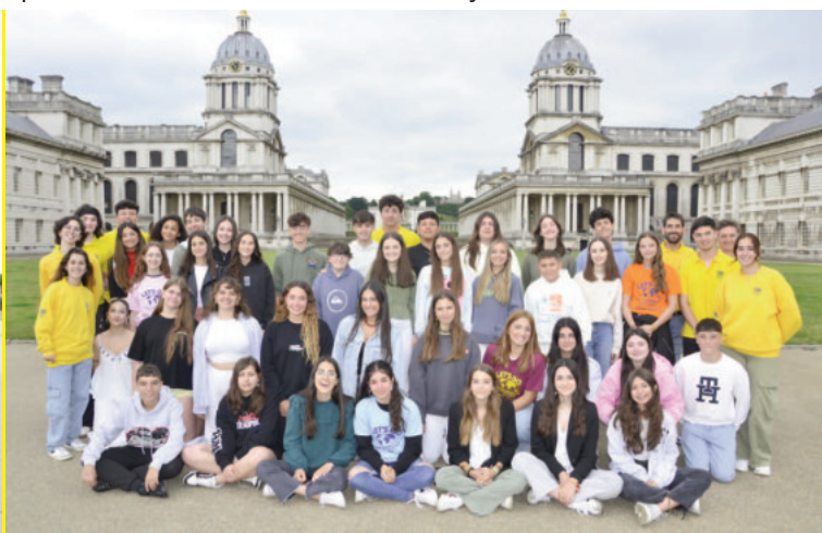
Regresarás a España con un gran bagaje cultural resultado de esta experiencia como estudiante internacional.