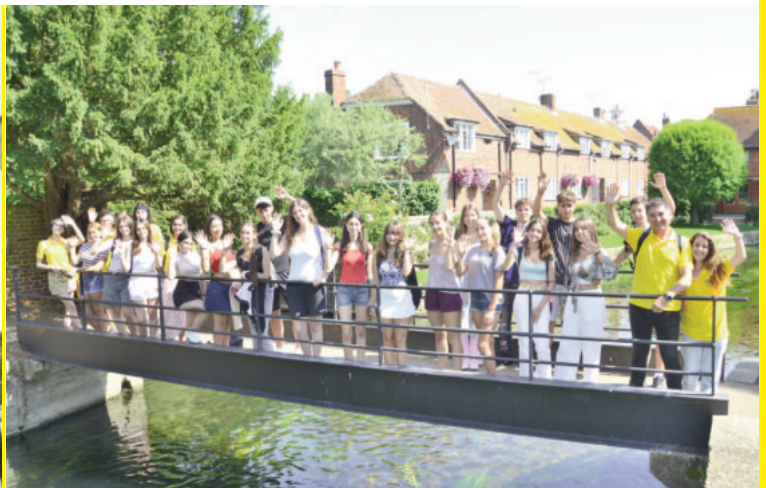
A lo largo de la estancia lingüística tus profesores organizarán diversas excursiones a otras localidades de interés.